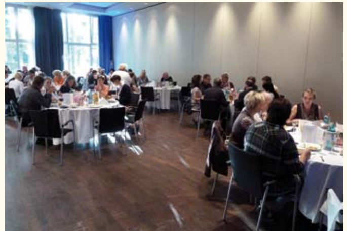
Festliches Ambiente im Ramada-Hotel in Kassel

Sprachlich brillant auf Altdeutsch dargeboten und mit spaßig-frecher Einbeziehung der Gäste, die in mehr oder weniger geräuschvolle Rollen schlüpfen durften, wurde der Abschlussabend zu einem wahrhaft märchenhaften Erlebnis.