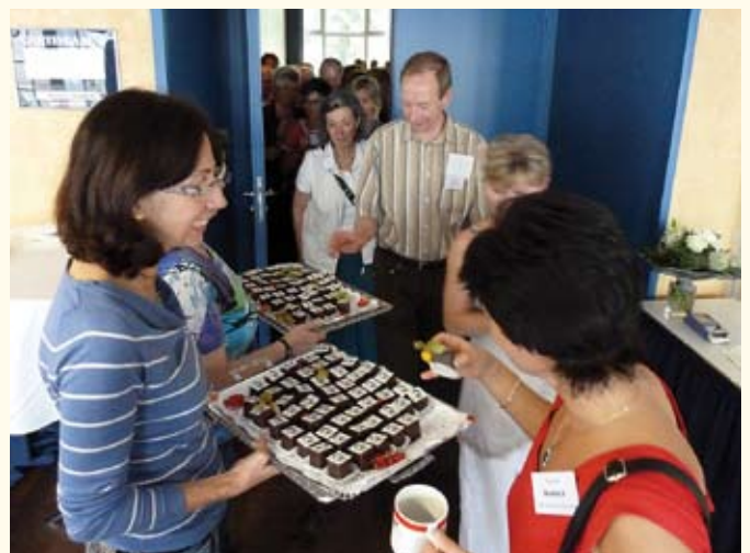
... wurden die Kongressteilnehmer in der Pause überrascht

Titelseite: Der „Herkules“ thront über Kassel Gesamtherstellung: ART & GRAFIK VERLAG, Ettlingen