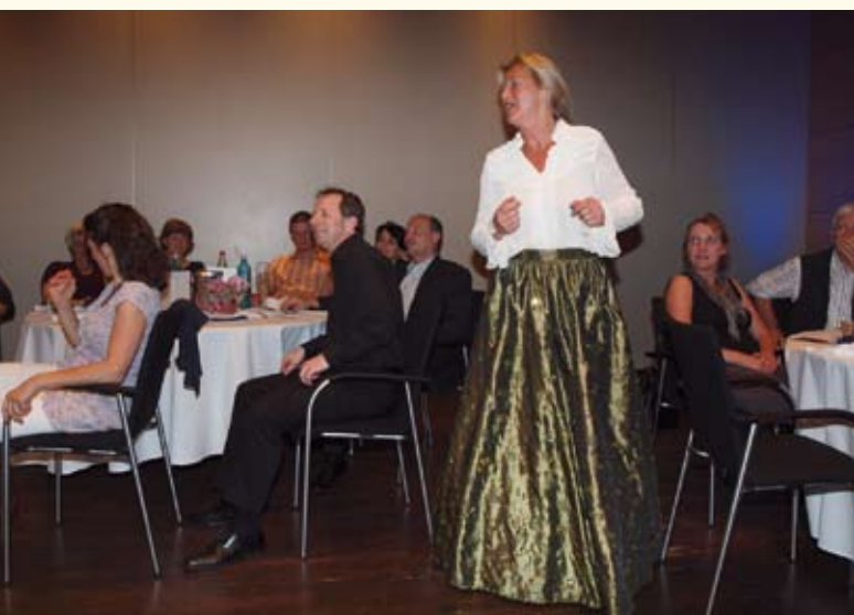
... bescherte den Kongressteilnehmern einen märchenhaften Abschlussabend