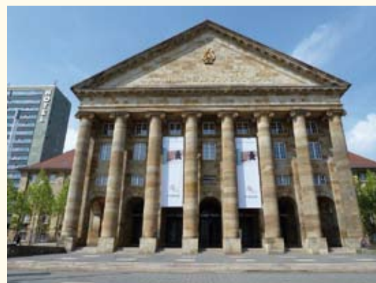
Stadthalle in Kassel