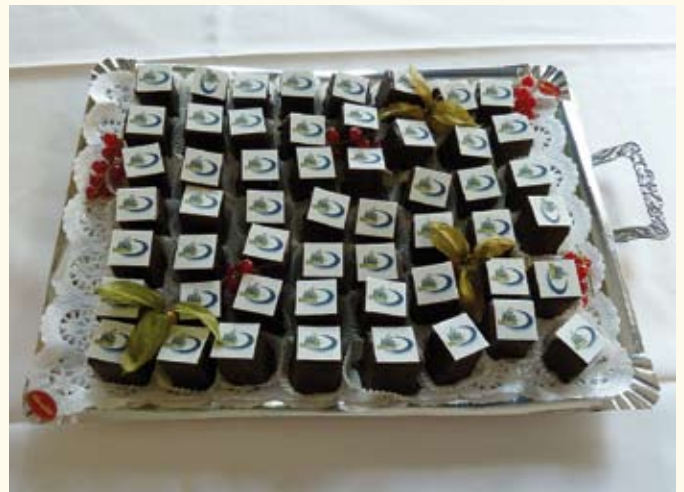
Mit leckeren Baumkuchen-Törtchen, verziert mit dem Vitametik-Logo ...