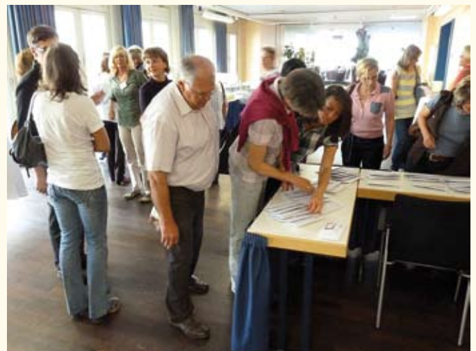
Die Kongressbesucher beim Empfang

Ihr Ziel ist es, zusammen mit den Kolleginnen und Kollegen an einer stärkenden und wachsenden Vernetzung des BVV mitzuwirken.